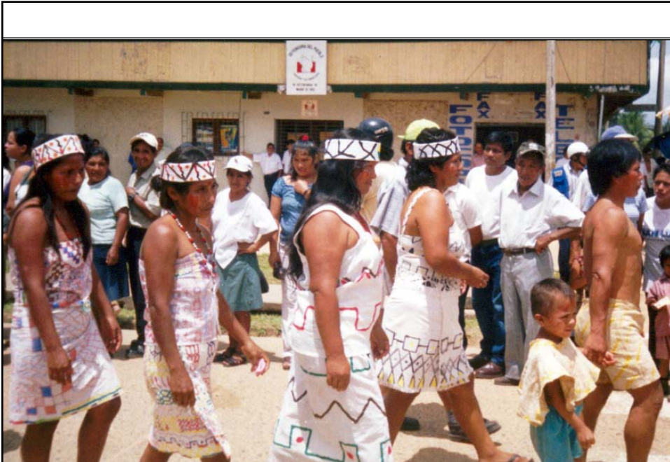
Sri Lanka (14-10-04)