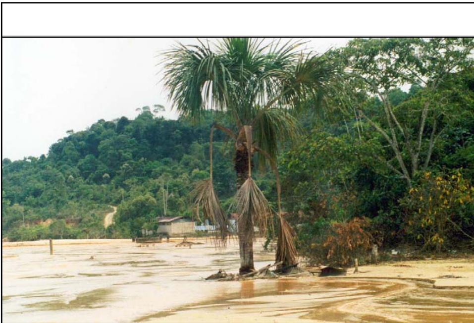
Sri Lanka (14-10-04)