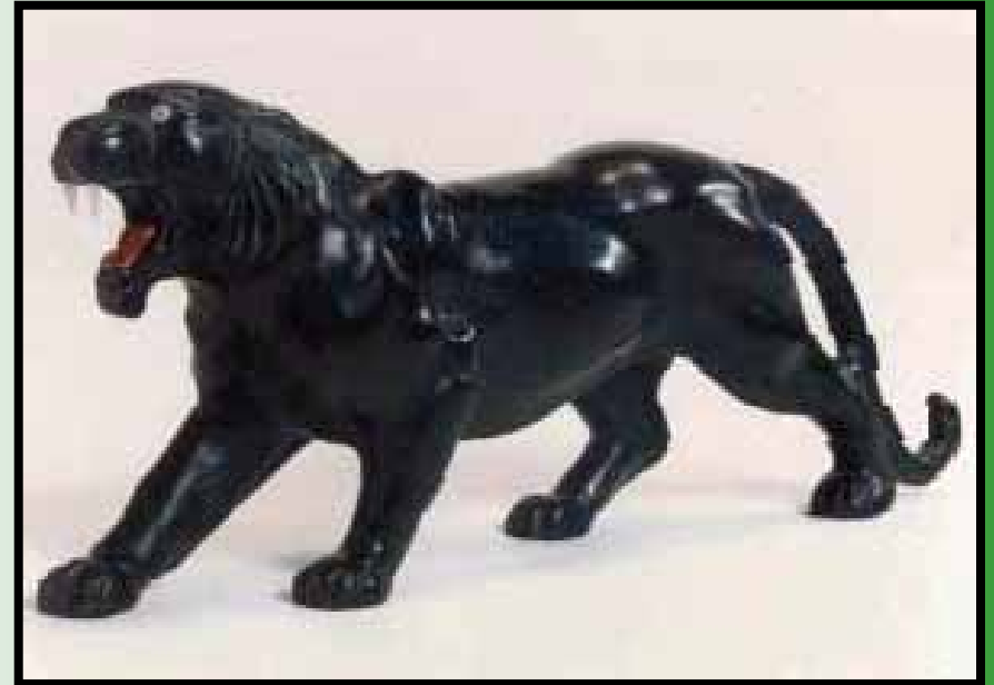
Pantera em xisto de esmeralda