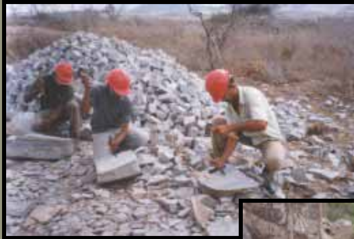
Artesãos produzindo paralelos