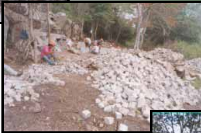
Aproveitamento de rejeitos de pedreira de granito