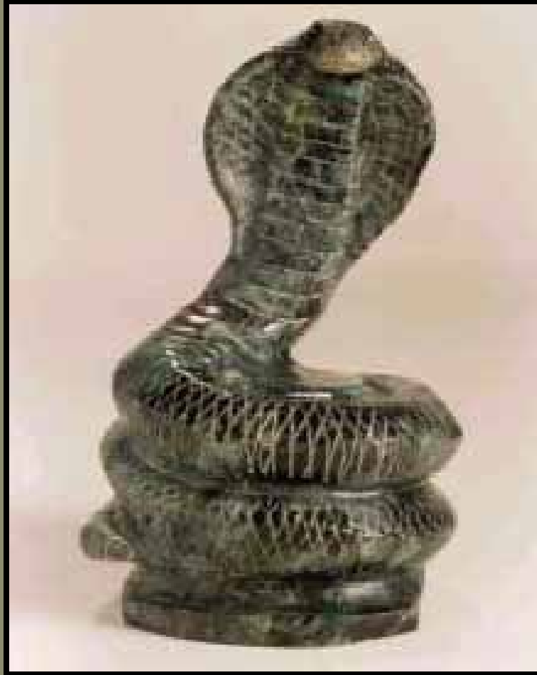
Naja em berilo de esmeralda