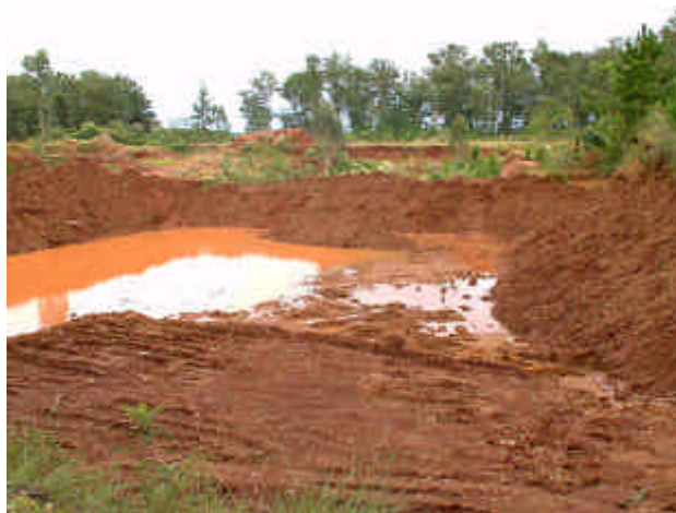
Figura 3: Vista de la cantera durante la etapa de construcción y movimiento de tierras.

Las distintas tareas llevadas a cabo estuvieron particularmente relacionadas con las obras de construcción y adecuación de la cantera (Figura 3), considerando las etapas propuestas en las etapas 1 a 3.