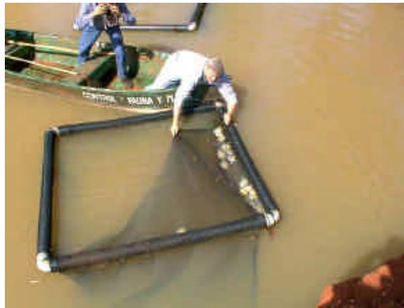
Figura 17: relevamiento de pacus en las jaulas flotantes

Durante las tareas de engorde de las distintas especies deben mencionarse el óptimo crecimiento manifestado en los ejemplares de pacú, los cuales fueron alimentados en las jaulas con una baja densidad de ejemplares, según se observa en las Figuras 17 y 18.