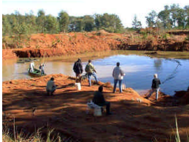
Figura 21: método de pesca con red de arrastre para el seguimiento del crecimiento de surubi.

Dicho seguimiento del desarrollo de los peces se realizará en forma regular y periódica mediante métodos de pesca selectivos (Figura 21) que permitan capturar los ejemplares para la toma de datos de crecimiento y realizar una nueva suelta de los peces en el ámbito de la cantera hasta el momento a determinar la captura y posterior suelta en el río Paraná.