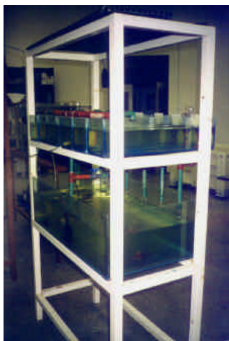
Figura 7: Vista general de una estructura con los acuarios de cría intensiva.

La aclimatación de las larvas capturadas, cuyo tamaño fue de 7 a 11 milímetros se llevo a cabo en acuarios con capacidad de 30 litros. Para la cría se utilizaron acuarios con capacidad de 150 a 180 litros (Figura 7). Cabe mencionar que las experiencias fueron realizadas con agua de río, cuya renovación en los acuarios se realizo cada dos días.