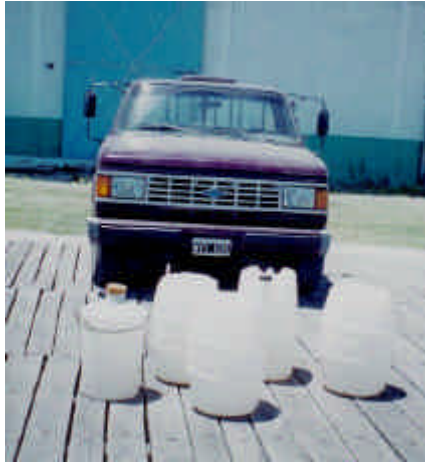
Figura 6: Equipamiento utilizado para el transporte de larvas hasta las instalaciones de cría.

El traslado de las larvas de peces desde el lugar de muestreo hasta los laboratorios de cría se realizo en vehículo mediante bidones adecuados para el transporte de larvas (Figura 6).