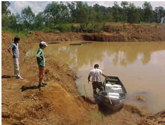
Figura 14: Traslado de los juveniles de pacu hacia las jaulas flotantes.

Para el traslado y siembra de los peces de las distintas especies se siguió la modalidad implementada para el pacu como se observa en las figuras 14 y 15.