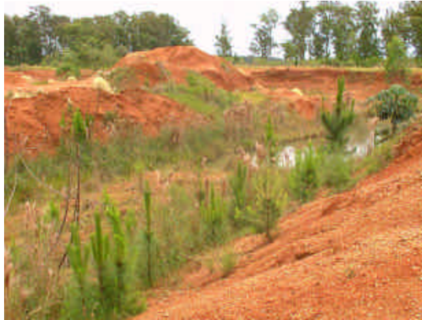
Figura 2: Toma sur hacia el centro. Muestra el sector definitivo en el sector sur (cota 90).

3ra. Etapa: canal del área 550 a cota 86