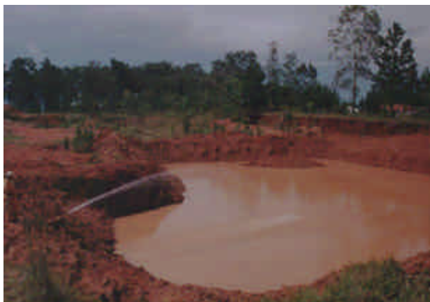
Figura 4: llenado de agua del recinto.

El llenado del recinto destinado para la cría de los peces se realizó hasta obtener una profundidad acorde para lograr la menor mortalidad de los ejemplares, que por las condiciones ambientales de la región se consideró en mantener en los 3,50 mts aproximadamente.