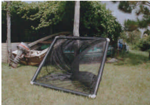
Figura 11: jaulas flotantes para la cría y engorde de peces en la cantera de Candelaria.

La siembra de los peces se realizó en jaulas flotantes de 2 mts de lado y 2,50 mts de profundidad, construidas mediante caños de PVC y red mediasombra comunmente utilizadas en la actividad de piscicultura (Figura 11).