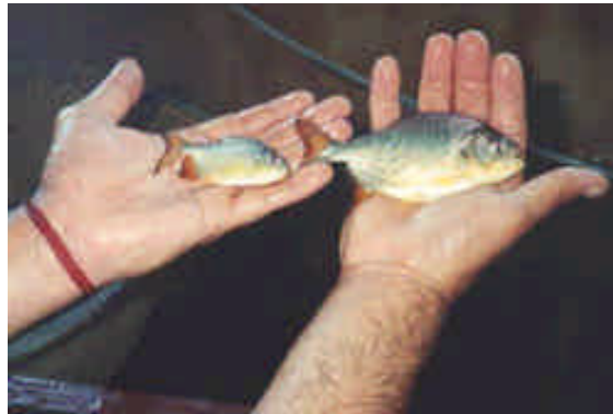
Figura 13: pacus ( P. mesopotamicus ) sembrados en la cantera de Candelaria

Con relación a la siembra de pacu (Figura 13), esta fue realizada gracias a una donación de peces de una piscicultura ubicada en Formosa.