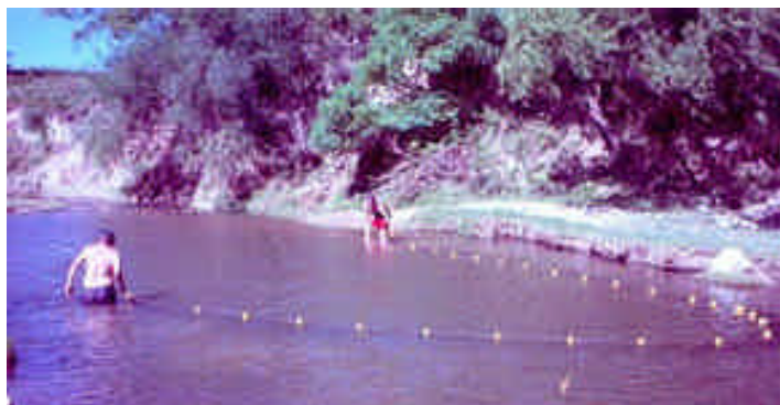
Figura 9: maniobra de tendido de la red de arrastre costera para captura de juveniles de sábalo ( P. lineatus .)

La captura de juveniles de sábalo ( P. lineatus ) (Figura 10) se realizó mediante una red de arrastre costera que permitió la extracción de juveniles para la cría y engorde en jaulas en la cantera seleccionada. La maniobra de tendido de la red para la captura es descrita en la Figura 9.