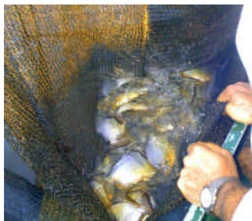
Figura 18: Relevamiento de pacus en las jaulas flotantes