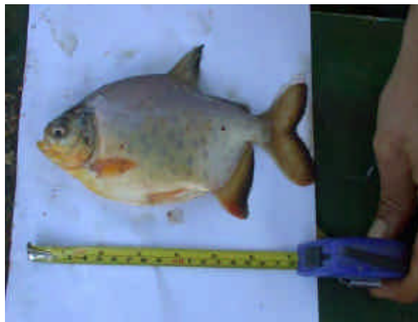
Figura 19: ejemplar de pacu de 180 mm de 60 días de engorde.

En la Figura 19 se puede observar el tamaño de los pacus, de aproximadamente 180 mm, a los 60 días, tomando en cuenta que el tamaño en el momento de la siembra fue de 50 mm, lo cual permite pensar en programar actividades productivas futuras para la especie, en el marco de las propuestas planteadas en el proyecto.