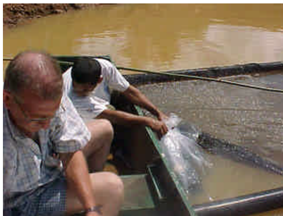
Figura 15: maniobra de suelta de juveniles de pacu.