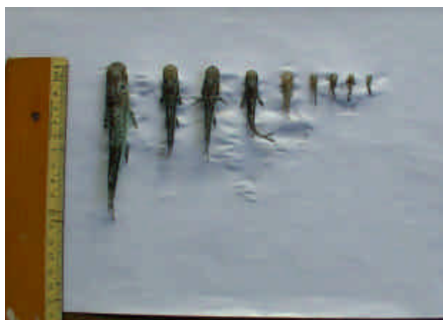
Figura 16: larvas y juveniles de surubí ( P. coruscans ) trasladados para la siembra.

La longitud total de las larvas de surubí ( P. coruscans ) en el momento de la siembra en la cantera fue entre de 20 y 100 mm (figura 16).