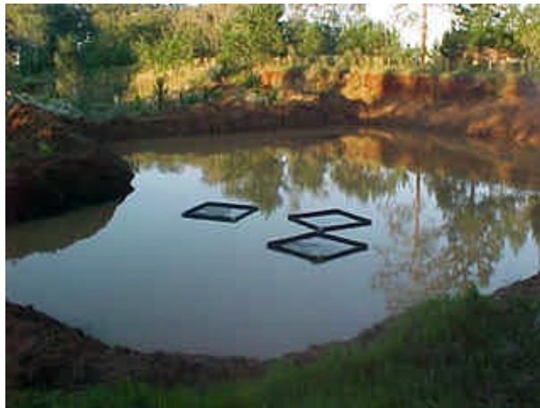
Figura 12: vista de las jaulas flotantes en la cantera de Candelaria (Misiones).

Las jaulas flotantes fueron colocadas en una cantera de 30 x 40 mts de dimensión y 3,50 mts de profundidad (Figura 12).