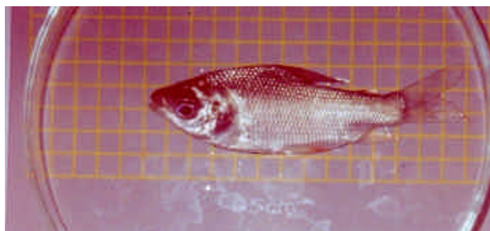
Figura 10: juveniles de sábalo ( P. lineatus ) de 70 mm capturados en el valle aluvial del Río Paraná, mediante la red de arrastre costera.