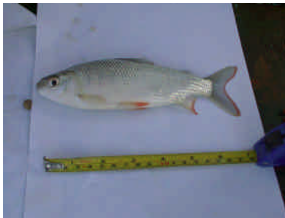
Figura 20: ejemplar de sábalo a los 60 días de engorde.

Con relación al sábalo, cabe destacar su excelente adaptación a la cría en jaulas, considerando la primera experiencia al respecto, manifestada en su rápido crecimiento en un corto período de tiempo desde su siembra en las jaulas con un tamaño de 50 mm hasta 170 mm obtenidos luego de 60 días de las experiencias de engorde (Figura 20).