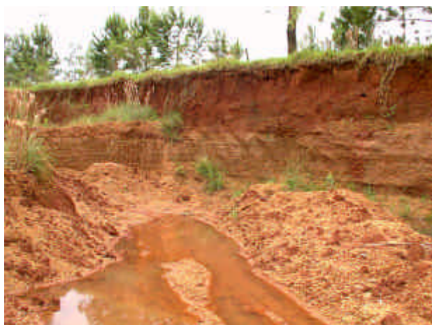
Figura 1: Vista del sector sudeste hacia el norte. El primer plano (abajo a la izquierda) correspondería al cierre temporal del recinto (cota 89).