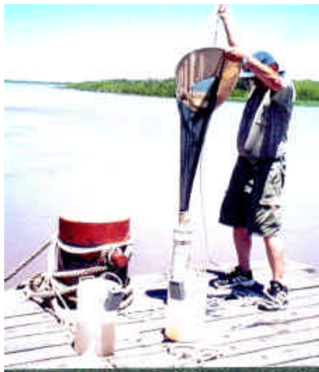
Figura 5: Muestreo de larvas de peces mediante la red de Ictioplacton.

El método para la detección de las larvas, realizada en el valle aluvial del río Paraná (Diamante) se realizó en horario nocturno cada dos o tres días, hasta detectar su presencia, a partir del cual la intensidad de los muestreos se realizó en forma diaria. Para la captura fue utilizada una red de ictioplankton de 300 micras como se observa en la Figura 5.